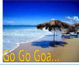
Go Go Goa...